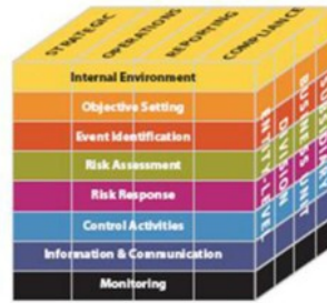
Gambar 2 Komponen ERM

tentuan dengan risiko dengan risiko dan peluang yang berhubungan dan meningkatkan kemampuan organisasi untuk memberikan nilai tambah. Menurut COSO ERM (2004), proses manajemen risiko dapat dibagikan ke dalam 8 komponen. Sebagaimana dijelaskan pada gambar berikut ini :